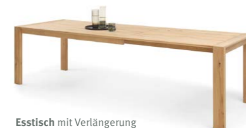
Esstisch mit Verlängerung

Die LED-Griffbeleuchtung setzt einen zusätzlichen Akzent und leitet die Hand zuverlässig zur Aluminium-Griffleiste.